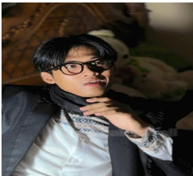
Gambar 3.1 Foto: Sayyidul Barqi

Sayyidul Barqi merupakan salah satu konten kreator dakwah muda di Indonesia yang aktif menyebarkan pesan-pesan keislaman melalui media sosial, salah satunya platform TikTok. Ia dikenal sebagai pendakwah yang mengemas pesan dakwah dengan gaya komunikasi yang sederhana, ringan, dan dekat dengan kalangan remaja, sehingga kontennya mudah dipahami oleh audiens muda. Selain TikTok, Sayyidul Barqi juga aktif di media sosial lain sebagai bagian dari penyebaran dakwah digital di era modern.